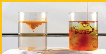
Prašak prirodnog ekstrakta kurkumina

Što je bistrija tečnost, to je veća biorasploživost. Što je veća biorasploživost, više je kurkumina apsorbovano. Što je delotvornija apsorpcija, veća je i snaga Solgar Curcumina.*