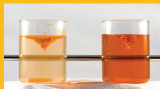
Prašak prirodnog ekstrakta kurkumina